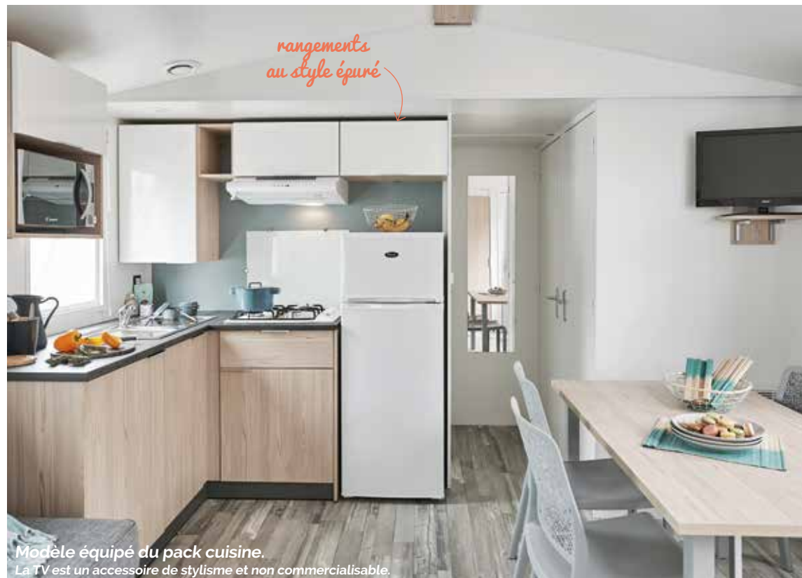
Modèle équipé du pack cuisine. La TV est un accessoire de stylisme et non commercialisable.

* Convertible en option. ** Soumis à un minimum de commandes. Données et photos non contractuelles (les prises de vues et implantations peuvent comporter des équipements décoratifs non fournis par Rapidhome ou optionnels). Rapidhome se réserve le droit de modifier ses produits à tout moment sans préavis.